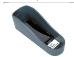
底座 (含校准块, 标配)