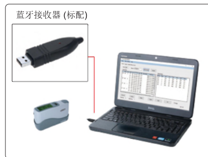
通过蓝牙连接电脑