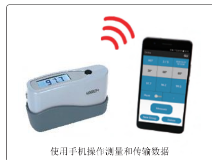
使用手机操作测量和传输数据 通过蓝牙连接手机 (仅限安卓系统)